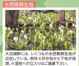
大沼湖畔には、いくつもの水鳥の生息地が点在している。例年4月中旬から下旬が見頃。※湿地への立入りはご遠慮下さい。