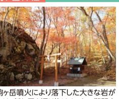
駒ヶ岳噴火により落下した大きな岩があり、割れ目を通り抜けることで麓開突破の奇観があるといわれている。(2019年4月現在、落石のため通り抜けはできません)

秀峰「北海道駒ヶ岳」 剣ヶ峰1,131m 北海道駒ヶ岳 砂原岳1,113m 駒ヶ岳1,131m 馬の背902m 駒ヶ岳892m 登山期間:6/1~10/31 ※状況により変更あり 元々は、富士山のように整った形をした山であったといわれているが、度々噴火の山活動により山頂が吹き飛ばされ、現在の山容となった。活火山のため、入山規制あり。例年6~10月、馬の背まで登頂することができる。