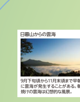
9月下旬頃から11月末頃まで。朝明けの雲海は幻想的な風景。