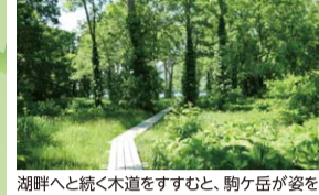
湖畔と続く木道を歩くと、駒ヶ岳を望む。春には水芭蕉や水仙が咲き、夕暮れ時にもお天気の撮影スポット。