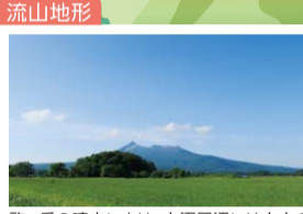
駒ヶ岳の噴火により、大沼周辺には大小の小山状の地形ができ、湖沼には126もの島々が形成された。これは流山地形といわれ、全国的にも珍しい地形。畑や水田の中にもあちこちに小山が見られる。