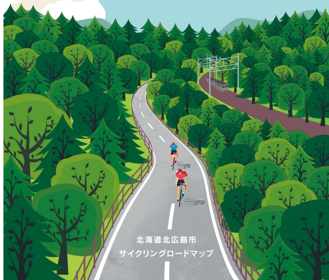
北海道北広島市 サイクリングロードマップ